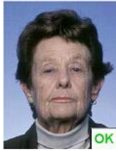
Testa non centrata

Non ci devono essere ombre nè sul viso nè sullo sfondo (Fig.7) che deve essere uniformemente illuminato